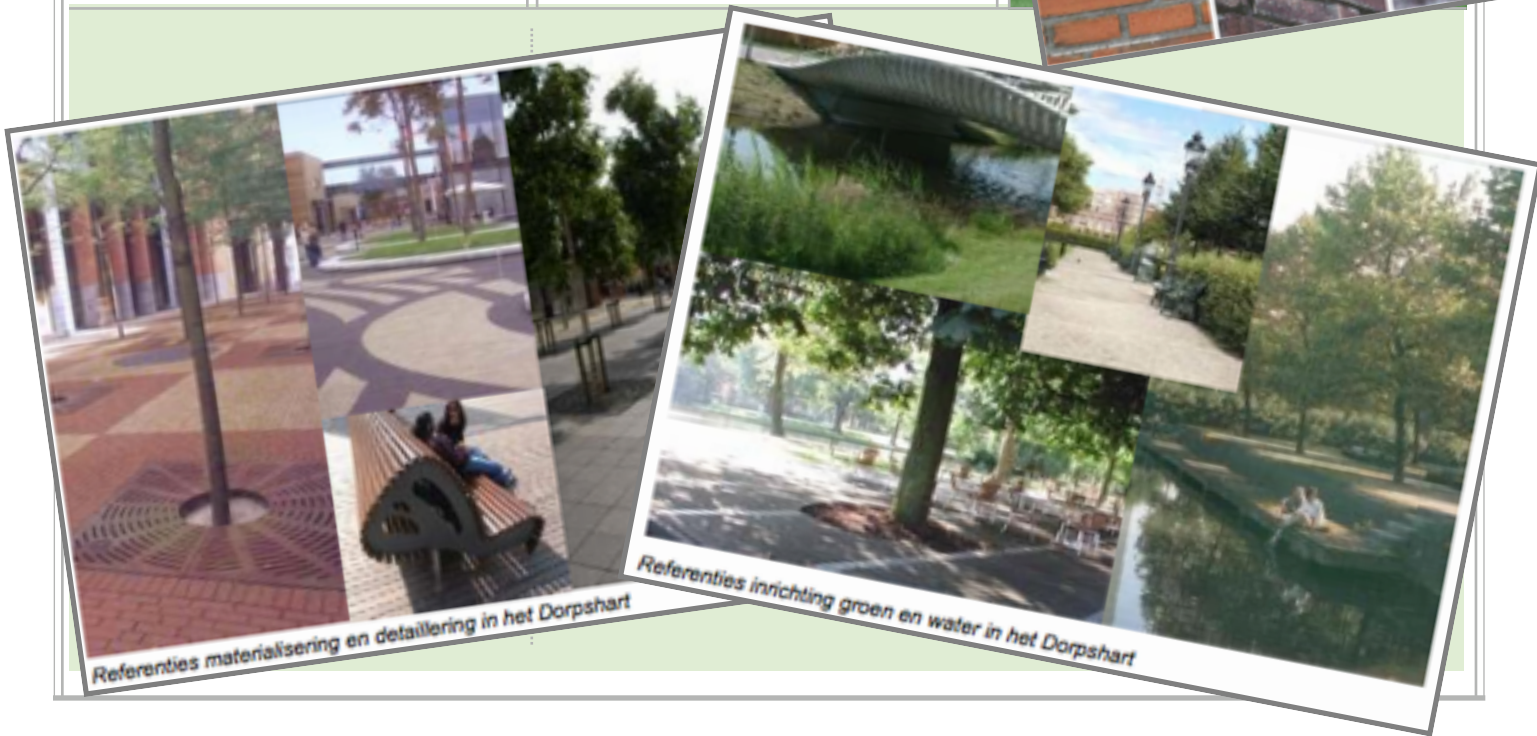
Referenties materialisering en detaillering in het Dorpshart