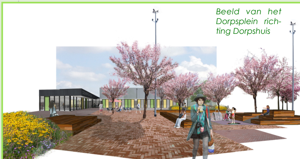
Beeld van het Dorpsplein richting Dorpshuis

Voor Sint zijn hielen licht, nog dit laatste gedicht. Op uitdrukkelijk verzoek van Klaas en Zwarte Piet. De Kerstman zal straks de scepter zwaaien, en het Dorpsplein verfraaien?!