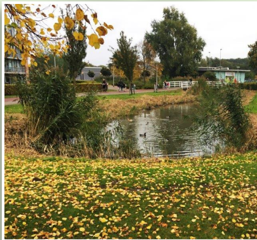
Sloot bij de Meidoornstraat