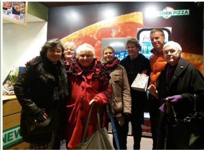
Betrokken én vasthoudende Duivendrechtters zetten vertrekkende burgemeester Mieke Blankers in het zonnetje!

Een gemiste kans is de mening van de Drechtje -bezoekers, die snel de laatste weekendinkopen doen.