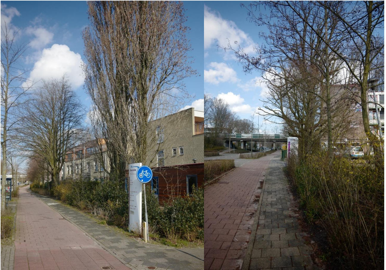
Van Duivendrecht- Zuid richting kruising van der Madeweg; kleine bomen in de heg, grotere bomen langs voetpad