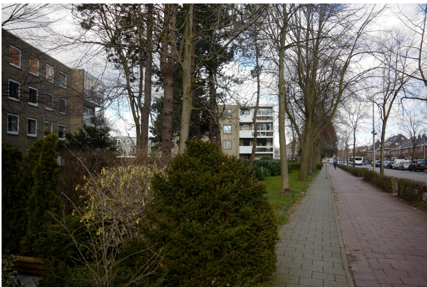
Rijksstraatweg in noordelijke richting: Karakteristieke lange bomenrij, voetpad, fietspad, heg met bomen op regelmatige afstand.