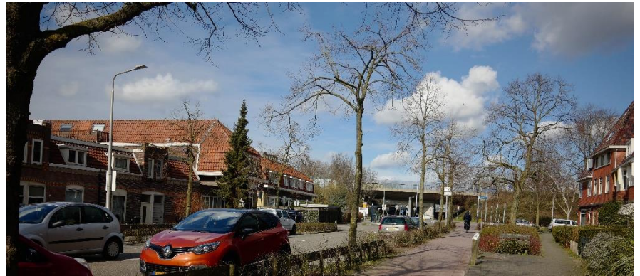
Duivendrecht-Zuid Beide entrees Rijksstraatweg ontvangst met een groene bomen allee. Duivendrecht – Noord