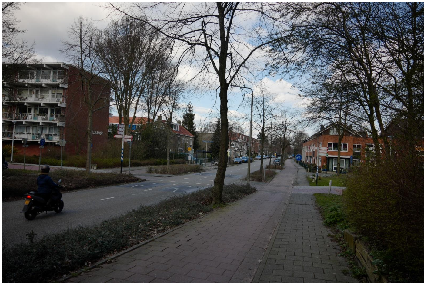
Rijksweg kruising van der Madeweg richting centrum o.a. Dorpsplein.

Gehele Rijksweg: Een cadans van bomen in lange heggen, de scheiding tussen fietspaden en de rijweg en struiken en bomen tussen voetpad en bebouwing