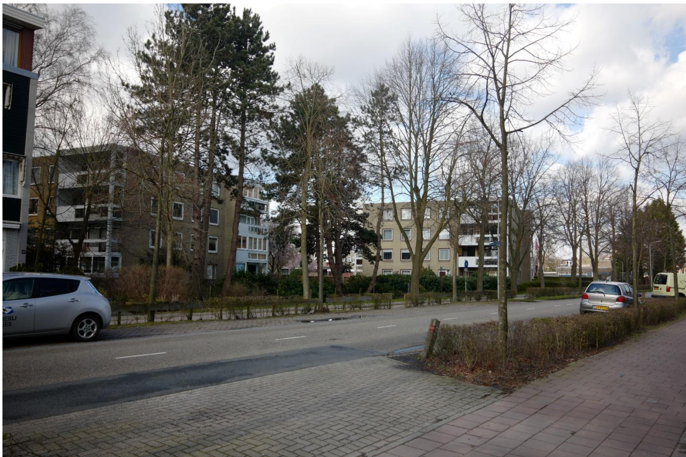
Rijksstraatweg ter hoogte van het Waddenland 2 van de 6 appartementcomplexen liggen aan deze weg.