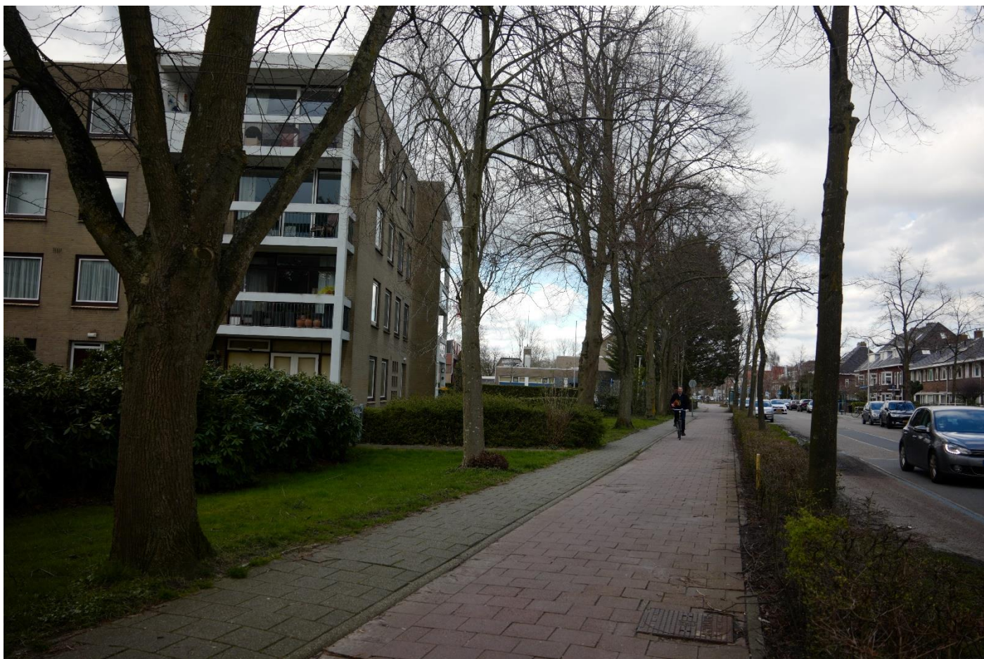
Traditioneel : RIJKSSTRAATWEG DUIVENDRECHT : Heggen met bomen scheiding fietspaden met de rechte rijweg. Bomen scheiding voetpaden met woningen/woncomplexen.